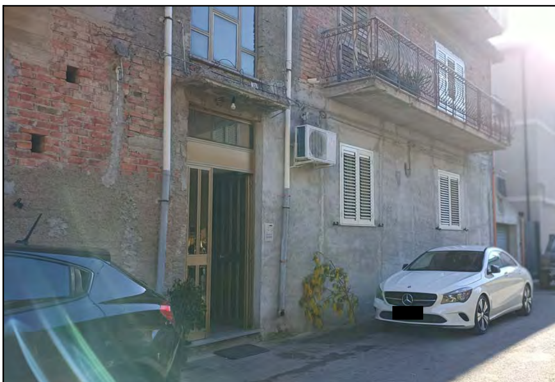
Portone di ingresso dell'immobile