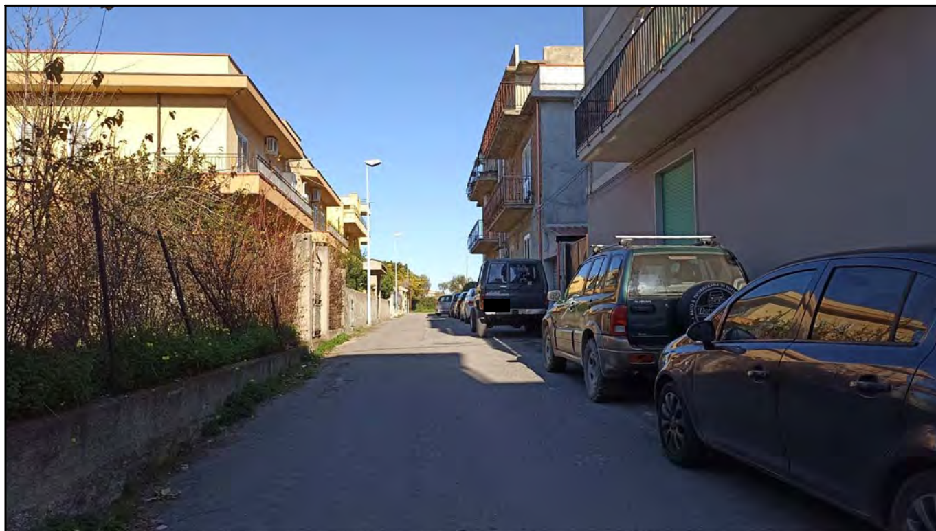
Strada chiusa di accesso perpendicolare alla via Risorgimento - Via F. Crispi