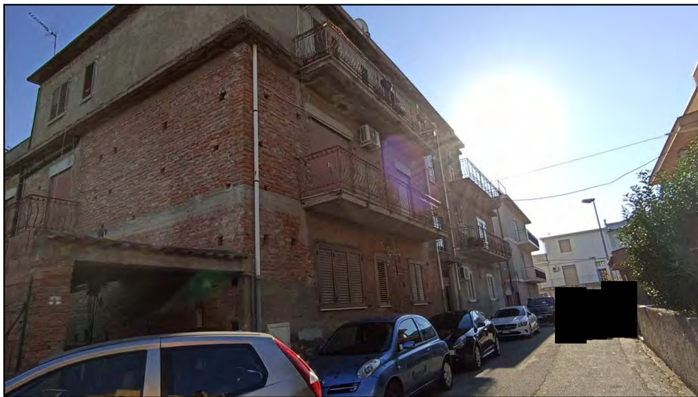
Fabbricato foglio 9 part. 837 comprendente gli immobili